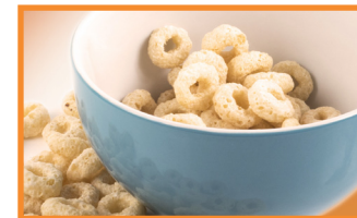
கையால் சாப்பிடும் உணவுகள்

ஏனைய உணவுக் குழுக்களில் இருந்தும் வேறுபட்ட உணவு வகைகளை அறிமுகப்படுத்தல் முக்கியமாகும். ஏனைய உணவு குழுக்களை அறிமுகப்படுத்தும் விதம் பற்றிய மேலதிக விபரங்களுக்கு 7&8 ம் பக்கங்களைப் பாருங்கள்.